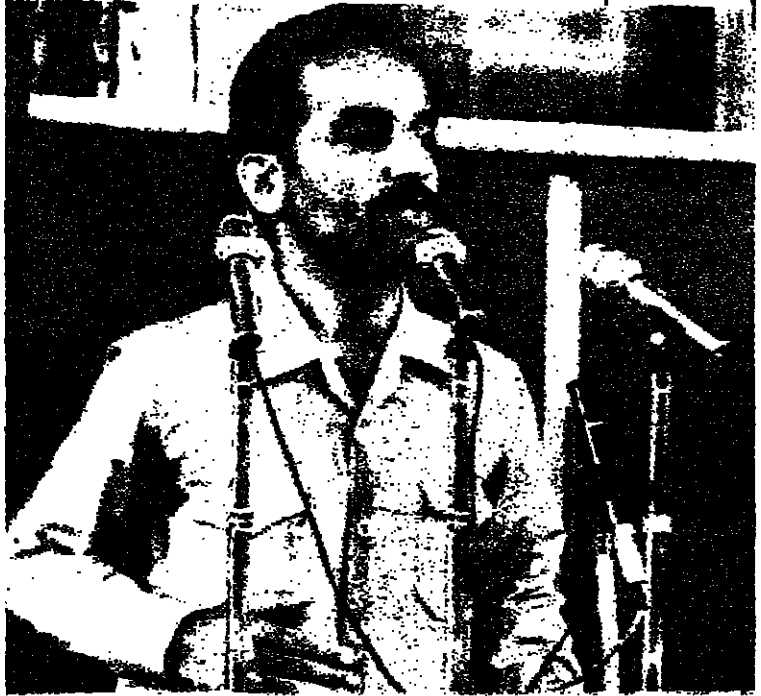
طهران - بدأ مجلس الشورى الإيراني أمس مناقشة منح الثقة لأعضاء الحكومة الإيرانية الجديدة برئاسة السيد محمد علي رجائي - وأعلن رئيس وزراء إيران آبراهام كلف في كلمة القاها أمام مجلس الشورى ان الشكوك التي ابداهها الرئيس بني صدر حول بعض الوزراء قد ازيت.

القدس - الخميس ٤ ايلول ١٩٨٠ الموافق ٢٥ شوال ١٤٠٠ هـ